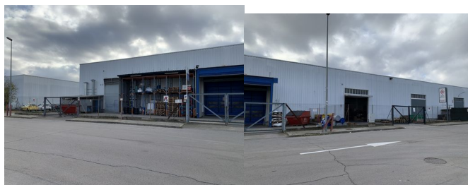
Zona a fer el contragual