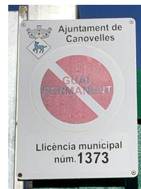
placa núm 1373 porta 1